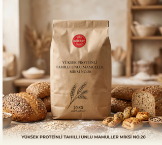
YÜKSEK PROTEİNLİ TAHILLI UNLU MAMULLER MİKSİ NO.20