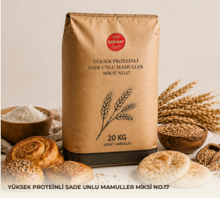
YÜKSEK PROTEİNLİ SADE UNLU MAMULLER MİKSİ NO.17

Fonksiyonel beslenme ile profesyonel üretim performansını buluşturan yüksek proteinli miks ürün ailesi.