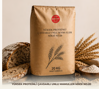
YÜKSEK PROTEİNLİ ÇAVDARLI UNLU MAMULLER MİKSİ NO.20