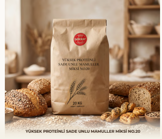
YÜKSEK PROTEİNLİ SADE UNLU MAMULLER MİKSİ NO.20